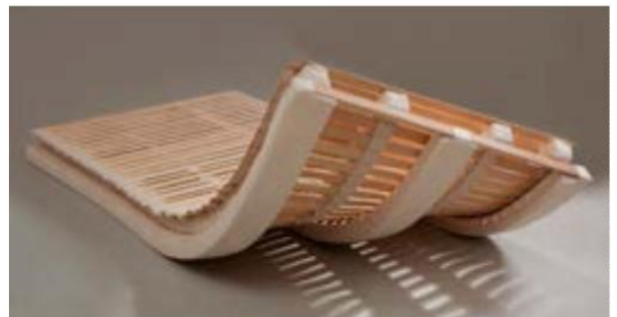
Dormo Novo Bettsystem